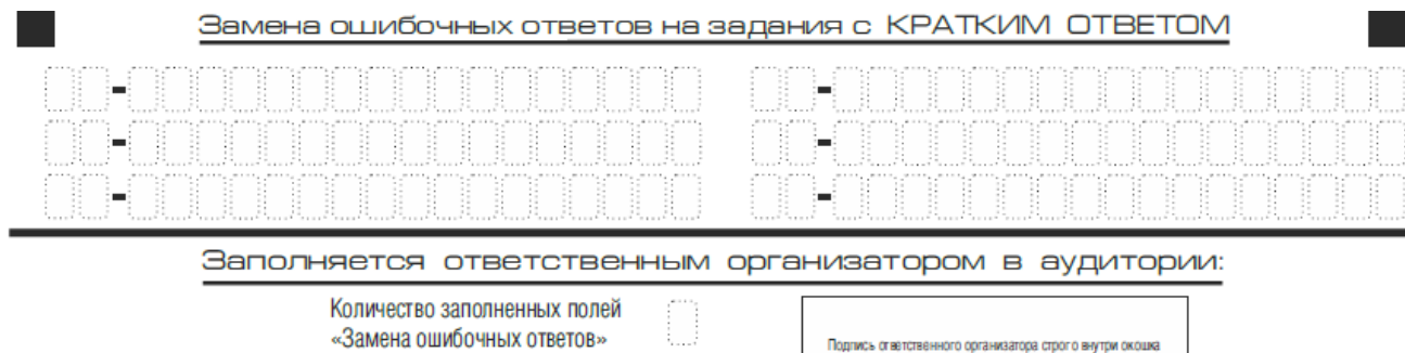
Рис. 9. Область замены ошибочных ответов на задания с кратким ответом

Запрещается записывать ответ в виде математического выражения или формулы. В ответе не указываются названия единиц измерения (градусы, проценты, метры, тонны и т.д.) – так как они не будут учитываться при оценивании. Недопустимы заголовки или комментарии к ответу.